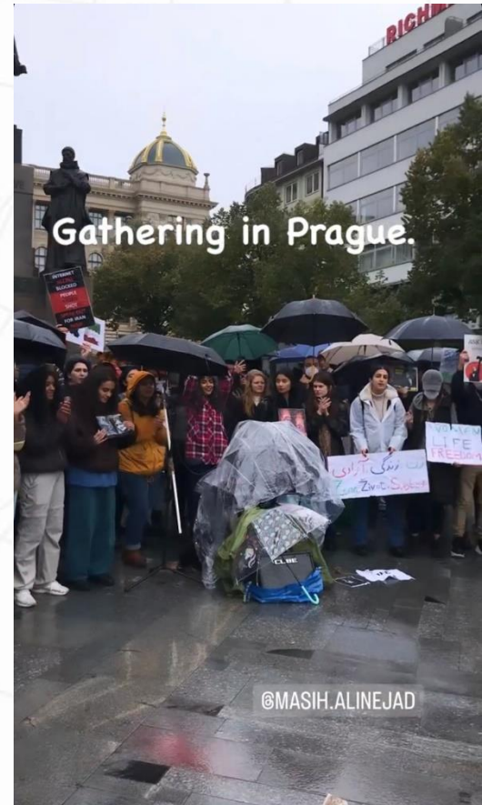
Gathering in Prague.